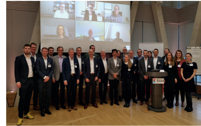
Teilnehmende der 7. Strategieberatung (14.03.2024)